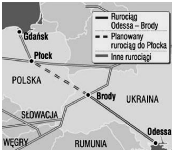
Rys 3. Rurociąg Odessa - Brody - Gdańsk [11]

wej ograniczając w ten sposób skutki ewentualnych awarii, kryzysów politycznych czy zagrożenia terrorystycznego. Powiązanie wydobycia ropy z Kazachstanu oraz rurociągu Odessa - Brody - Gdańsk poprawia strukturę importu ropy naftowej do Polski umożliwiając spełnienie postulatu dywersyfikacji paliw. Przyczynia się tym samym do zwiększenia bezpieczeństwa energetycznego dostaw ropy naftowej.