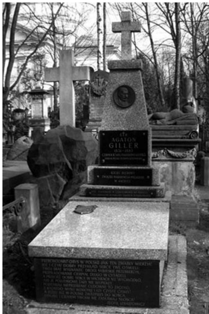
Nagrobek Agatona Gillera na warszawskich Powązkach

Bogactwo węglowe ziem polskich jest ogromne, i to nietylko dawne województwo Krakowskie posiada pokłady węgla kamiennego, ale także inne okolice, jak nowe poszukiwania przekonały, nie są ich pozbawione. Kraj, który oprócz urodzonej roli posiada obfitość soli, oleju skalnego, żelaza i wód mineralnych, ma świetną ekonomiczną przyszłość przed sobą.